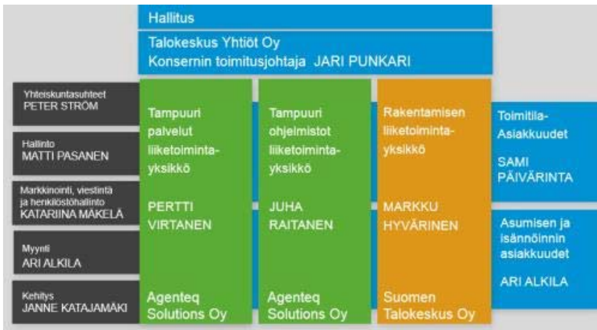
Kuva 1 Organisaatiokaavio

Talokeskus Yhtiöt Oy vastaa koko konsernin yhteisistä hallinnollisista tukipalveluista.